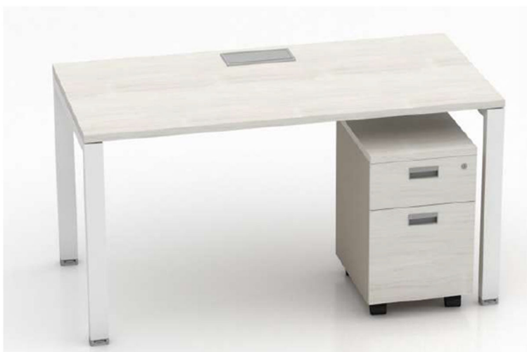
Imagen referencial M12