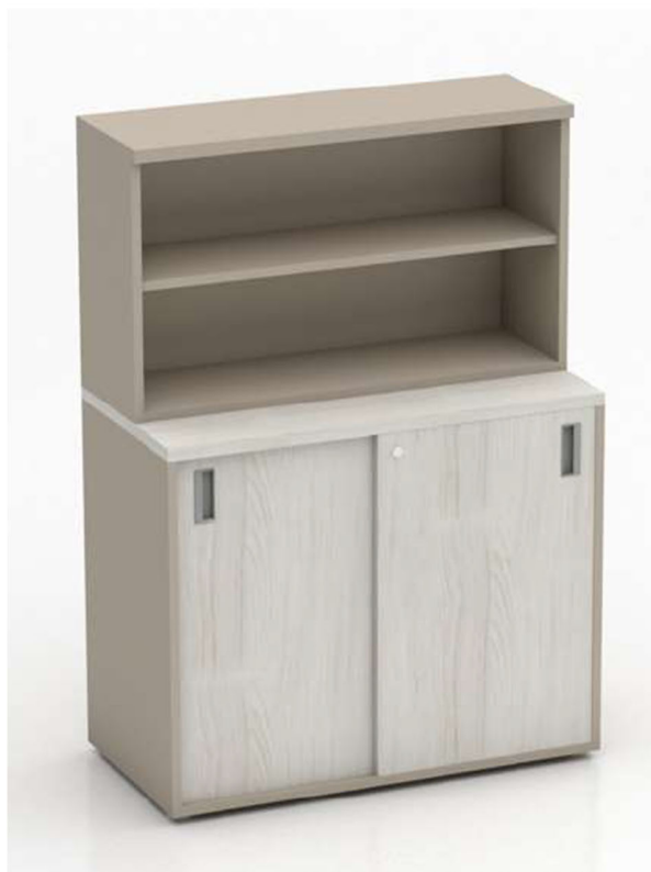
Imagen referencial M4a

BIBLIOTECA AJUSTE: Cubierta de 18mm de espesor de aglomerado melaminizado con cantos de ABS 2mm a tono. Casco de 18mm de espesor de aglomerado melaminizado con cantos de ABS 0.45mm a tono. Estantes en aglomerado melaminizado en sustrato de 25mm de espesor con cantos ABS al tono.