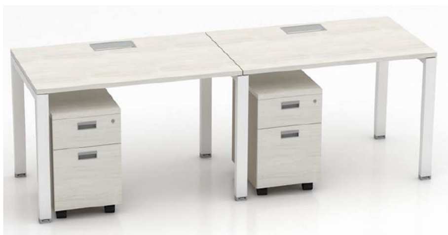
Imagen referencial M7

CAJONERA RONDANTE ANGOSTA: Cubierta de 25mm de espesor de aglomerado melaminizado con cantos de ABS a tono. Casco y frente con cantos ABS a tono, superficie de guardado compuesta por 2 cajones con 4 caras ingleteadas revestidos en PVC sin uniones mecanizadas, con fondo plus lavable. Cerradura a tambor frontal colectiva para todos los cajones. Tirador embutido de aluminio anodizado natural. Ruedas plásticas de alta resistencia.