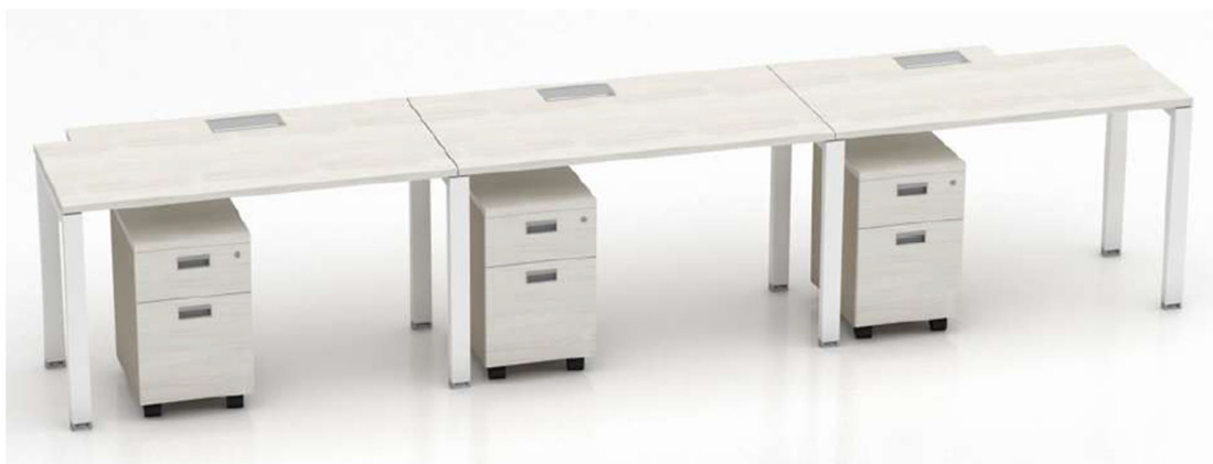
Imagen referencial M6a

CAJONERA RONDANTE ANGOSTA: Cubierta de 25mm de espesor de aglomerado melaminizado con cantos de ABS a tono. Casco y frente con cantos ABS a tono, superficie de guardado compuesta por 2 cajones con 4 caras ingleteadas revestidos en PVC sin uniones mecanizadas, con fondo plus lavable. Cerradura a tambor frontal colectiva para todos los cajones. Tirador embutido de aluminio anodizado natural. Ruedas plásticas de alta resistencia.