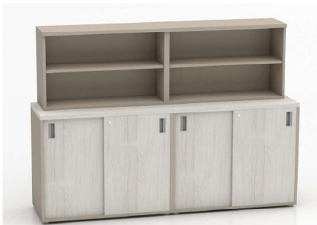
Imagen referencial M8

BIBLIOTECA AJUSTE: Cubierta de 18mm de espesor de aglomerado melaminizado con cantos de ABS 2mm a tono. Casco de 18mm de espesor de aglomerado melaminizado con cantos de ABS 0.45mm a tono. Estantes en aglomerado melaminizado en sustrato de 25mm de espesor con cantos ABS al tono.