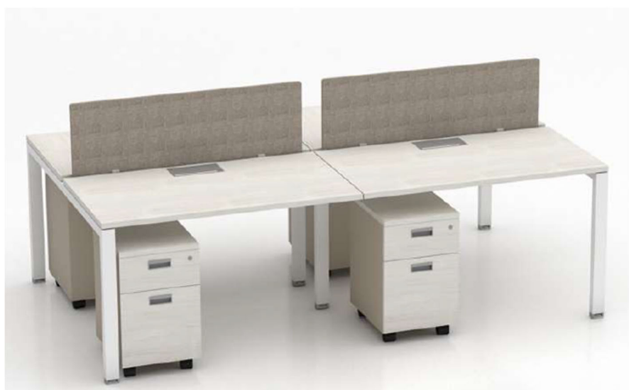
Imagen referencial M1

CAJONERA RONDANTE ANGOSTA: Cubierta de 25mm de espesor de aglomerado melaminizado con cantos de ABS a tono. Casco y frente con cantos ABS a tono, superficie de guardado compuesta por 2 cajones con 4 caras ingleteadas revestidos en PVC sin uniones mecanizadas, con fondo plus lavable. Cerradura a tambor frontal colectiva para todos los cajones. Tirador embutido de aluminio anodizado natural. Ruedas plásticas de alta resistencia.