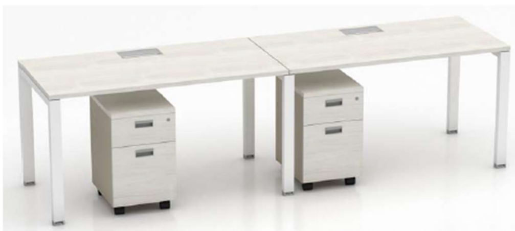
Imagen referencial M10

CAJONERA RONDANTE ANGOSTA: Cubierta de 25mm de espesor de aglomerado melaminizado con cantos de ABS a tono. Casco y frente con cantos ABS a tono, superficie de guardado compuesta por 2 cajones con 4 caras ingleteadas revestidos en PVC sin uniones mecanizadas, con fondo plus lavable. Cerradura a tambor frontal colectiva para todos los cajones. Tirador embutido de aluminio anodizado natural. Ruedas plásticas de alta resistencia.