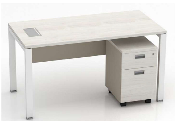
Imagen referencial M5

CAJONERA RONDANTE ANGOSTA: Cubierta de 25mm de espesor de aglomerado melaminizado con cantos de ABS a tono. Casco y frente con cantos ABS a tono, superficie de guardado compuesta por 2 cajones con 4 caras ingleteadas revestidos en PVC sin uniones mecanizadas, con fondo plus lavable. Cerradura a tambor frontal colectiva para todos los cajones. Tirador embutido de aluminio anodizado natural. Ruedas plásticas de alta resistencia.