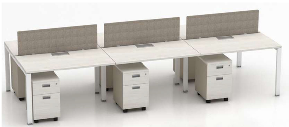
Imagen referencial M11

CAJONERA RONDANTE ANGOSTA: Cubierta de 25mm de espesor de aglomerado melaminizado con cantos de ABS a tono. Casco y frente con cantos ABS a tono, superficie de guardado compuesta por 2 cajones con 4 caras ingleteadas revestidos en PVC sin uniones mecanizadas, con fondo plus lavable. Cerradura a tambor frontal colectiva para todos los cajones. Tirador embutido de aluminio anodizado natural. Ruedas plásticas de alta resistencia.