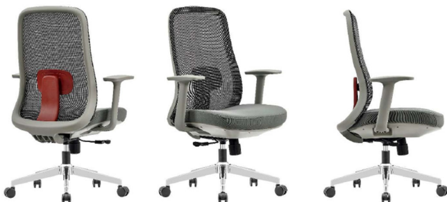
Imagen referencial S4

Se exige Certificación Bifma. Garantía 3 años