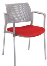
Imagen referencial S5

Silla con estructura 4 patas cromadas, asiento tapizado en tela y respaldo polipropileno, con brazos. Garantía: 5 años.