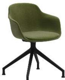
Imagen referencial S1