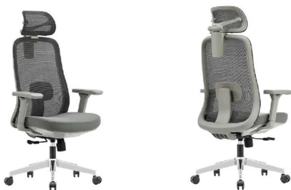
Imagen referencial S3

Se exige Certificación Bifma. Garantía 3 años