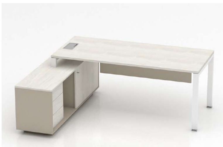
Imagen referencial M4

MODULO HORIZONTAL: Casco y tapa aglomerado melaminizado 18mm cantos ABS a tono, superficie de guardado compuesta por 3 cajones con 4 caras ingleteadas revestidos en PVC sin uniones mecanizadas, con fondo plus lavable. Cerradura a tambor frontal colectiva para todos los cajones. Patines regulables desde el interior del mueble, con llave Allen.