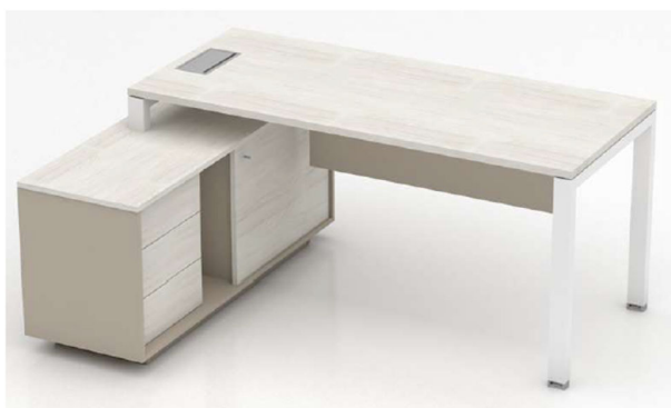
Imagen referencial M3

ESCRITORIO: Cubiertas en aglomerado melaminizado en sustrato de 25mm. de espesor con cantos ABS 2mm al tono. Estructura metálica tipo pórtico construida con perfil sección 60x40mm, electro pintada con pintura epoxi de alta resistencia, con patines regulables en polipropileno de alta resistencia ajustados a la sección del perfil de las bases. De regulación de altura manual sin necesidad de herramientas. Base pedestal metálica construida con perfil 60x40mm, electro pintada con pintura epoxi de alta resistencia. Las bases están unidas mediante viga metálica electro pintadas con pintura epoxi alta resistencia. Las cubiertas deben quedar separadas de las bases visualmente 5mm. Faldón en aglomerado melaminizado en sustrato de 18mm de espesor con cantos ABS 0.45mm al tono.