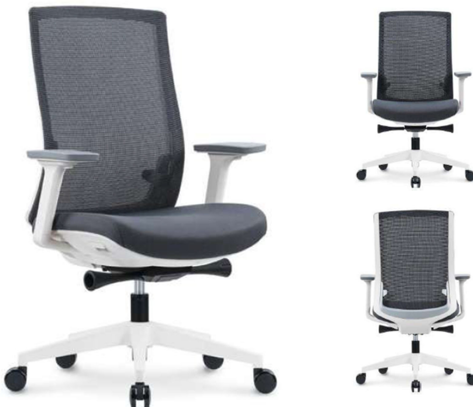
Imagen referencial S2