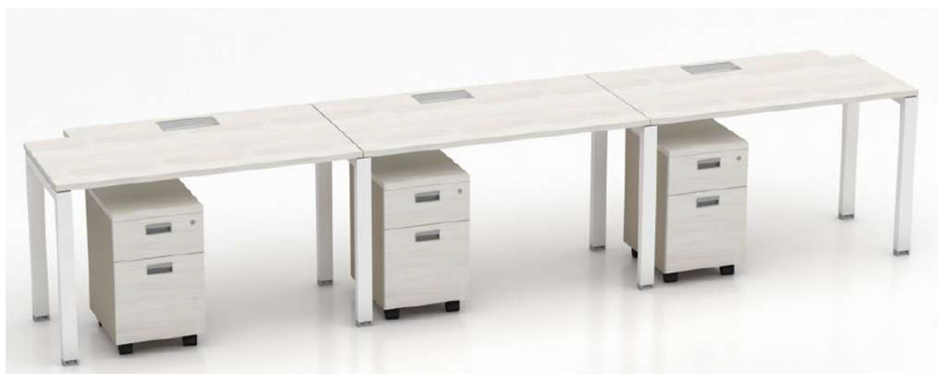
Imagen referencial M6

TANDEM: cubierta en laminado de alta presión en sustrato de 25mm de espesor con cantos ABS de 2mm al tono. Estructura metálica retraída tipo pórtico construida con perfil sección 60x40mm, electro pintada con pintura epoxi de alta resistencia, con patines regulables en polipropileno de alta resistencia. De regulación de altura manual sin necesidad de herramientas. Posee base interna retraída en caño sección 60x40mm. Las bases están unidas mediante viga metálica electro pintadas con pintura epoxi alta resistencia. Las cubiertas deben quedar separadas de las bases visualmente 5mm.