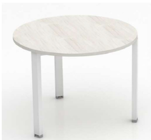
Imagen referencial M9

MESA REUNION: cubierta en laminado de alta presión en sustrato de 25mm de espesor con cantos ABS de 2mm al tono. Estructura metálica tipo pórtico construida con perfil sección 60x40mm, electro pintada con pintura epoxi de alta resistencia, con patines regulables en polipropileno de alta resistencia. De regulación de altura manual sin necesidad de herramientas. Las bases están unidas mediante viga metálica electro pintadas con pintura epoxi alta resistencia. Las cubiertas deben quedar separadas de las bases visualmente 5mm.