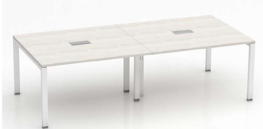
Imagen referencial M2

MESA REUNION: cubierta en laminado de alta presión en sustrato de 25mm de espesor con cantos ABS de 2mm al tono. Estructura metálica tipo pórtico construida con perfil sección 60x40mm, electro pintada con pintura epoxi de alta resistencia, con patines regulables en polipropileno de alta resistencia. De regulación de altura manual sin necesidad de herramientas. Posee base interna retraída en caño sección 60x40mm. Las bases están unidas mediante viga metálica electro pintadas con pintura epoxi alta resistencia. Las cubiertas deben quedar separadas de las bases visualmente 5mm.